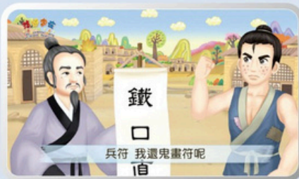
兵符 我還鬼畫符呢