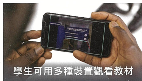
學生可用多種裝置觀看教材