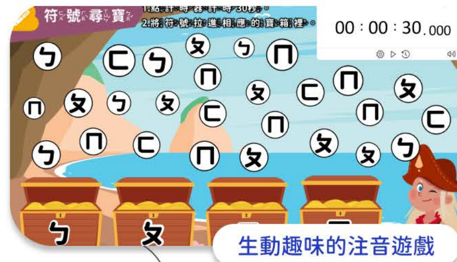
生動趣味的注音遊戲