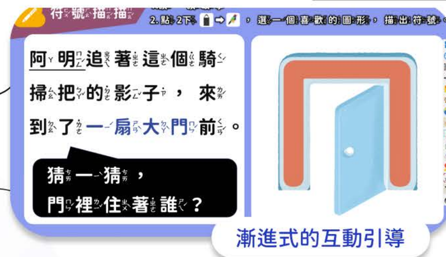
漸進式的互動引導