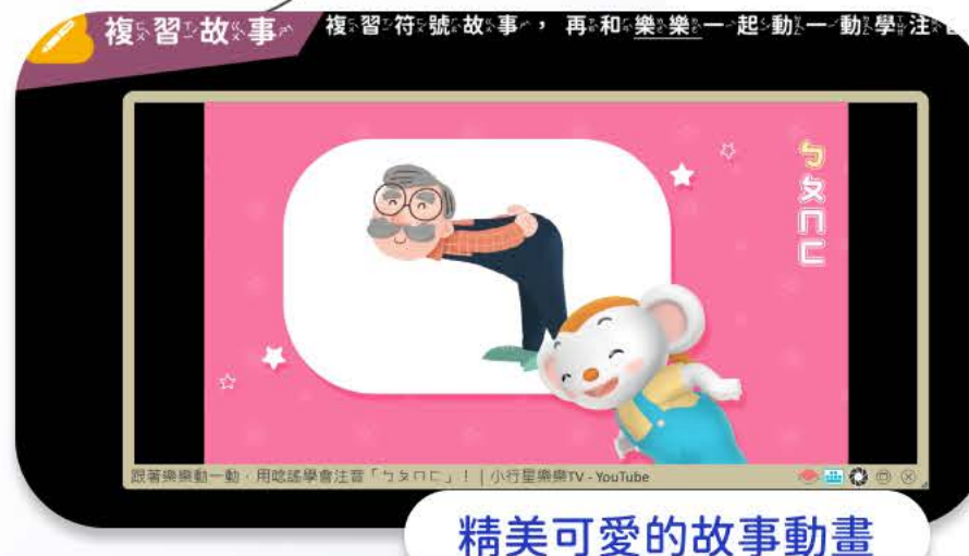
精美可愛的故事動畫