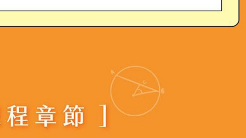
每天都要超玩數學