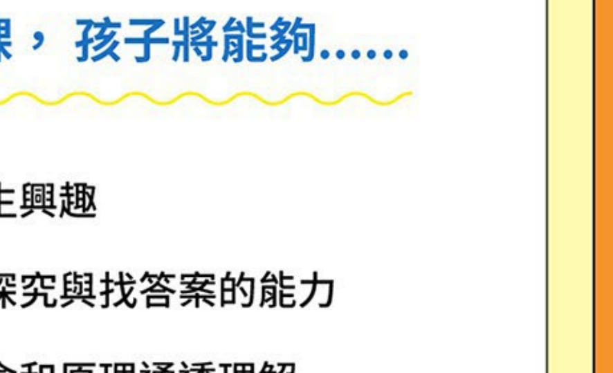
一面玩一面學，無痛學習