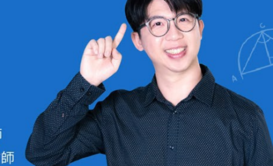
用雞兔同籠問題學習代數