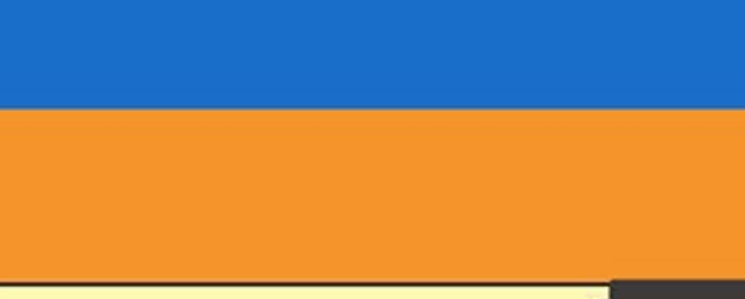
具象化理解乘法公式，不必死背