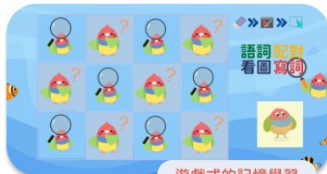
遊戲式的記憶學習