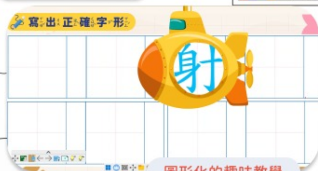
圖形化的趣味教學