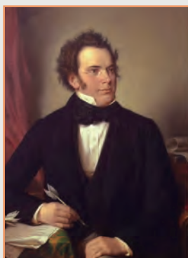
舒伯特 Franz Schubert 1797 - 1828