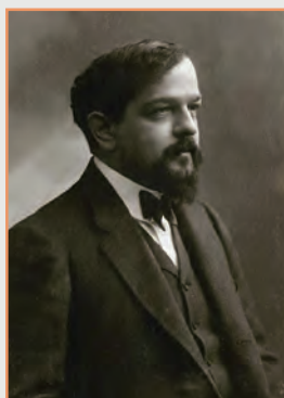
德布西 Claude Debussy (1860-1918)