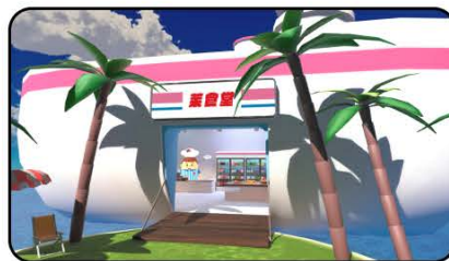
萊爾富品牌虛擬概念店 | 萊食堂