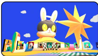
Rug Pull Frens | NFT 品牌合作展