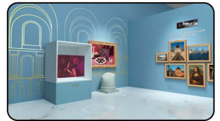
Häagen-Dazs | 羅浮宮藝術展