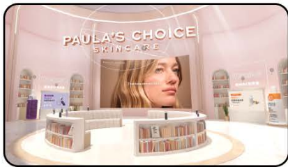
寶拉珍選 | 寶藏研究院