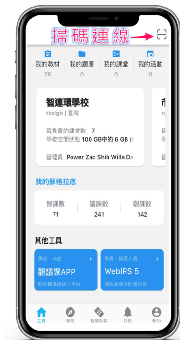
HiTeach 5 掃碼功能連線觀課