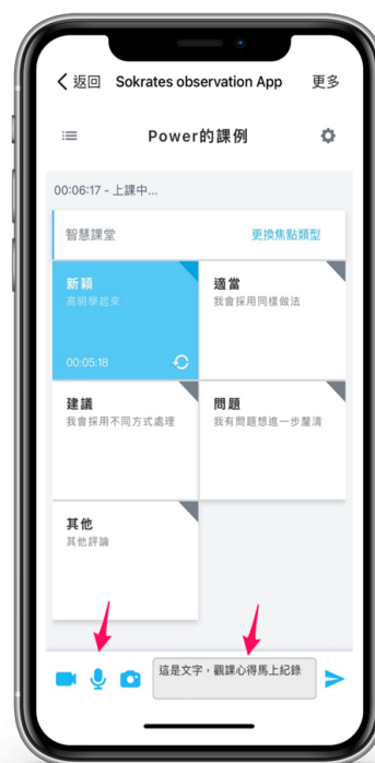
文字、照片、錄音或錄影紀錄