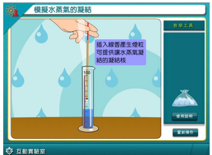
步驟化引導操作+搭配文字解說