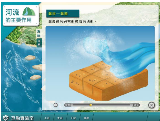
河流整體與分段介紹