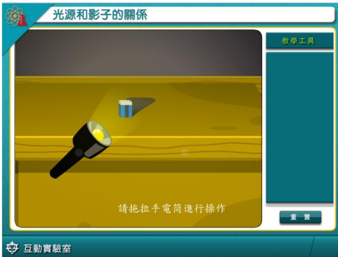
在平板中，可重複操作與觀察