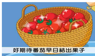
好期待番茄早日結出果子