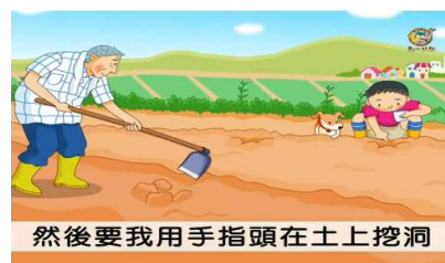
然後要我用手指頭在土上挖洞