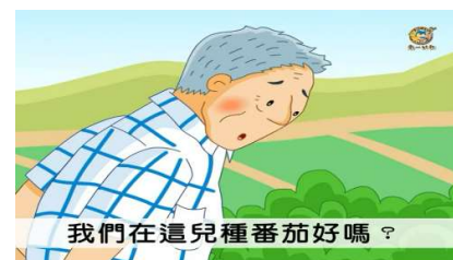
我們在這兒種番茄好嗎？