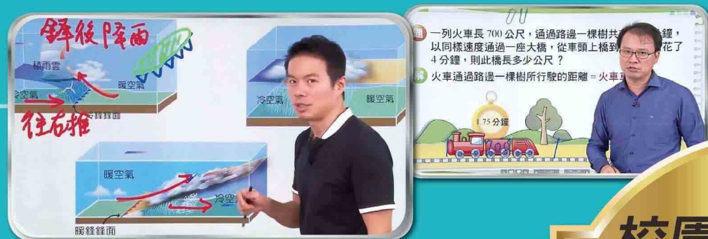
▲國高中名師精采課程畫面