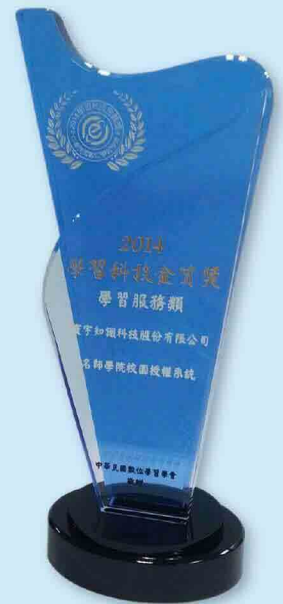
▲ 校園授權系統獲得「學習科技金質獎」殊榮