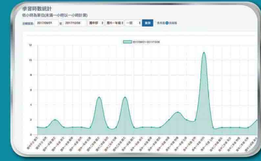
▲學習紀錄完整詳實