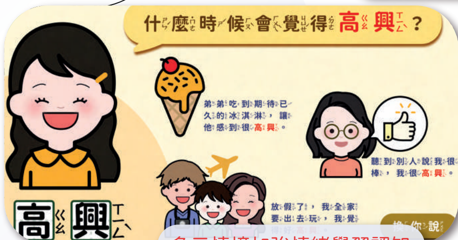
多元情境加強情緒學習認知