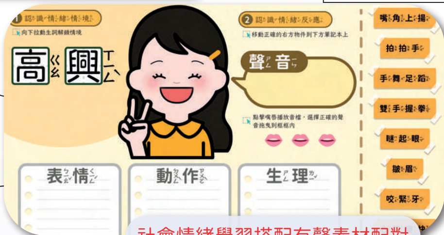
社會情緒學習搭配有聲素材配對