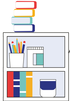
段落提問搭配多元寫作遊戲