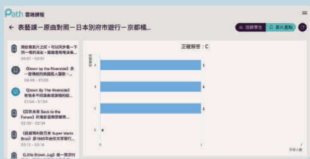
全班答題統計分析