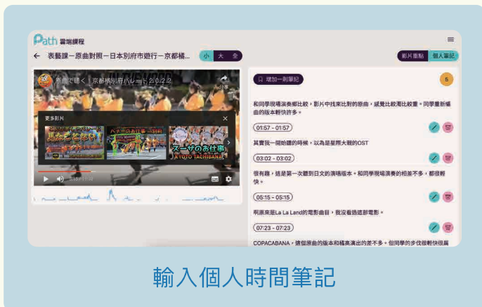
輸入個人時間筆記