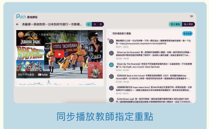
同步播放教師指定重點