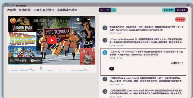
掌握學生學習重點與答題狀態