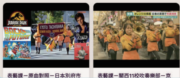
使用 YOUTUBE 影片為教材