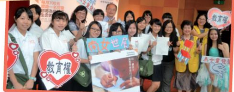
圖 3-1-3 保障孩童的人權尊嚴 世界展望會資助兒童計畫，協助兒童改善生存環境，包含衛生、糧食、乾淨飲用水、醫療，還有提供課業與保護及教育的機會。