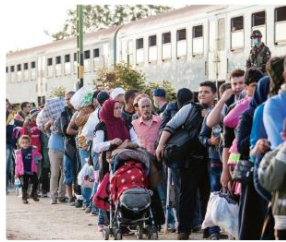
圖 3-1-2 逃難的民眾 在無情的戰爭摧殘下，許多人為了逃離戰爭，被迫離開鄉井，無依無靠。

在單元頁中，西非的兒童因為貧困被迫成為童工，失去學習的權利，也阻礙了未來的發展。這樣的生活處境，對於享有義務教育的我們是很難想像的。