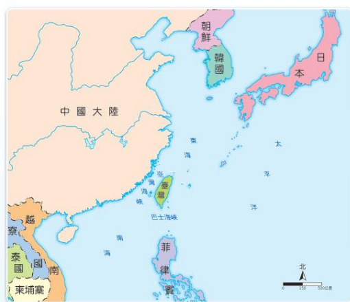
▲ 臺灣與亞洲、太平洋地區各國相對位置圖。

臺灣四面環海，位於亞洲與太平洋的交會處，東方是太平洋，西方隔著臺灣海峽與中國大陸相望，南方以巴士海峽與菲律賓相鄰，北方可經由東海通往日本、朝鮮與韓國等國家。