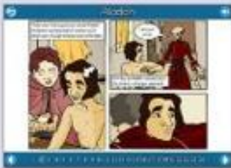
Visual text types - 'graphic novels'