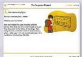
Description - all stories

敘述文，知識性閱讀，步驟式閱讀 圖文式閱讀，非文學類敘述文，詩詞韻文 傳記，辯論，介紹式排版閱讀