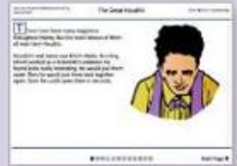
Narrative recounts - non-fiction