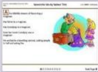
Narrative recounts - fiction across 28 genres at all levels