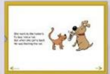
Poetry / verse