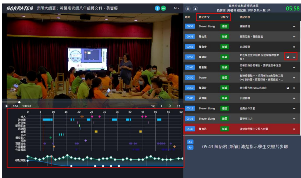
教學行為特徵、標記者與分類篩選、圖片及連結都是觀課的好工具

數位觀議課平臺上的蘇格拉底影片具有多維連動的設計，觀看影片時，能夠依據教學行為特徵上的機器標記點，點擊立即跳到該影片片段播放；而右側的蘇格拉底專家標記清單，則可以依據觀課標記者篩選出標記內容，或者以標記分類來篩選出標記，點擊任一標記也會立即跳到該影片片段播放，非常方便。此外，如果想要把某個標記時間點的影片紀錄或分享，則右側的超鏈結就會是非常棒的工具。