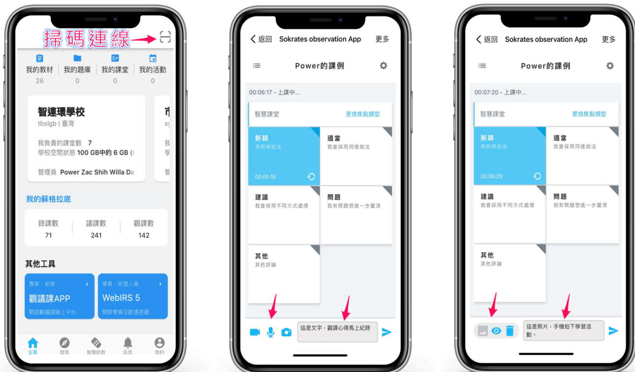
HITA 5掃碼功能連線觀課