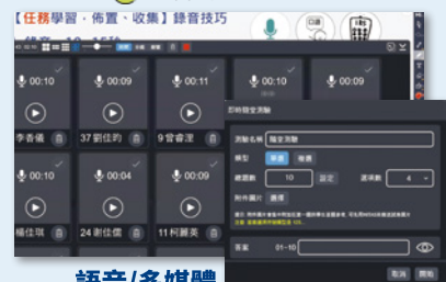
語音/多媒體檔案收集觀摩