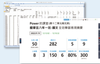
課後自動產出 學習表現摘要