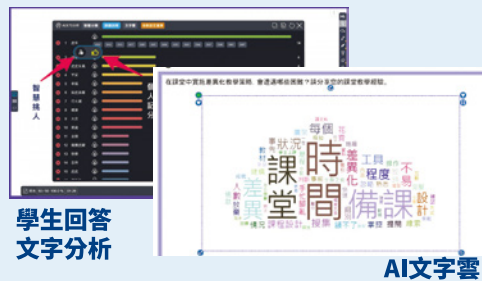
學生回答文字分析