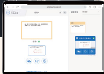
學生載具 內建畫板