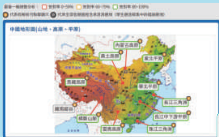
隨機記憶統整報告