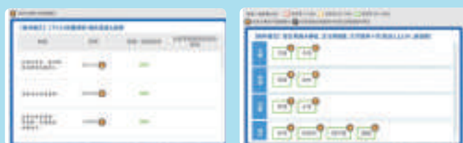
配對記憶統整報告