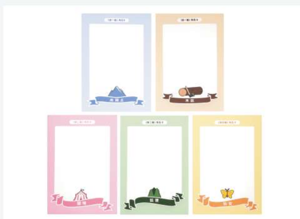
▲ 角色卡 (免組裝)