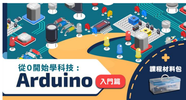
從0開始學科技：Arduino入門篇+材料包